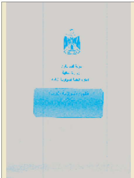
קטעים מתוך התקציב השנתי של הרשות הפלסטינית (2014)