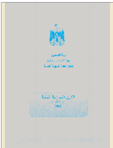
קטעים מתוך התקציב השנתי של הרשות הפלסטינית (2016)