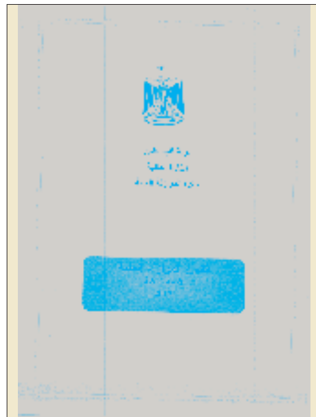
קטעים מתוך התקציב השנתי של הרשות הפלסטינית (2013)