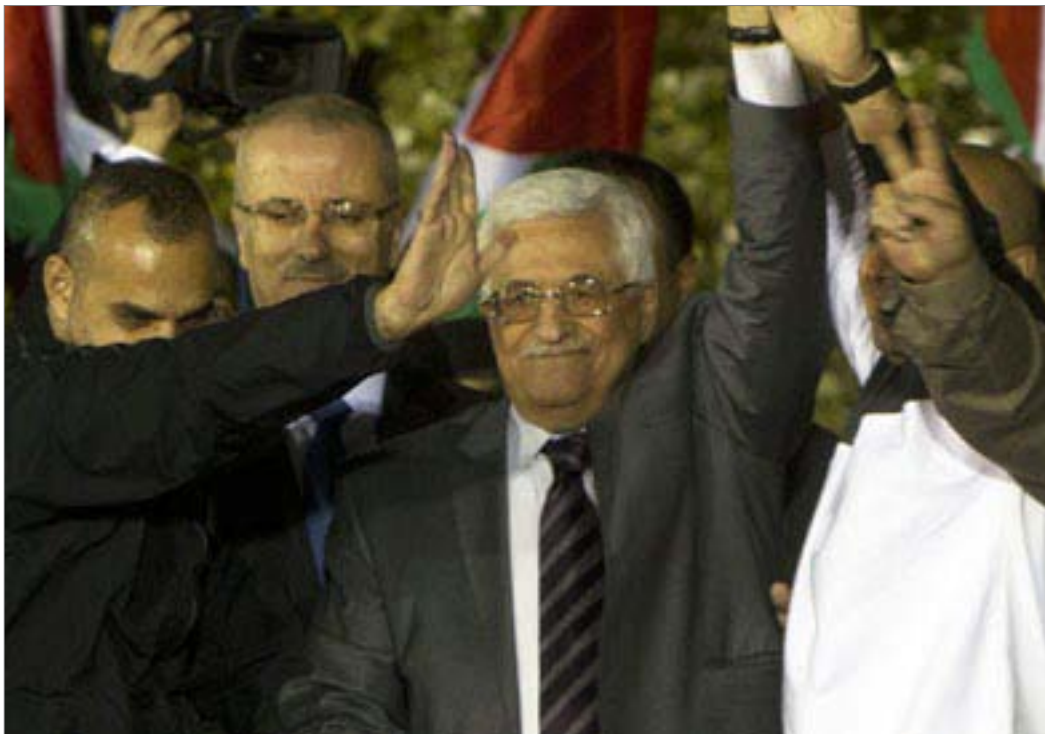
י"ר הרשות הפלסטינית מחמוד עבאס מקבל את פני המחבלים ששוחררו ב-2013 (תצלום AFP). (Photo/Ahmad Gharabli)

הרשות עיגנה את תשלום המשכורות לאסירים ולמשפחות המחבלים ההרוגים בסדרה של חוקים וצווים ממשלתיים, במיוחד חוקים 14 ו-19 מ-2004 וחוק 1 מ-2013 (ראו נספח 5). על פי חוקים אלה האסירים הם "מגזר לוחם, וחלק בלתי נפרד מרקמת העם הפלסטיני", ויש להבטיח את הזכויות הכספיות של האסיר ומשפחתו. הרשות תעניק את הקצבה לכל אסיר ללא אפליה - קצבה חודשית במשך שנות המאסר, ומשכורות ומשרות לאחר השחרור. האסירים זכאים גם לפטור מתשלום עבור חינוך וטיפול רפואי, ולהכשרה מקצועית. הרשות מחשבת את שנות המאסר שלהם כשנות ותק בשירותה. כל מי שנידון לחמש שנות מאסר ויותר זכאי למשרה, ודרגתו תהיה גבוהה יותר ככל ששנות מאסרו רבות יותר. המשמעות היא שהרשות נותנת עדיפות להעסקת מחבלים במנגנון הממשלתי שלה. ראש הרשות, עבאס, אמר יותר מפעם אחת כי "האסירים הם בעדיפות עליונה".